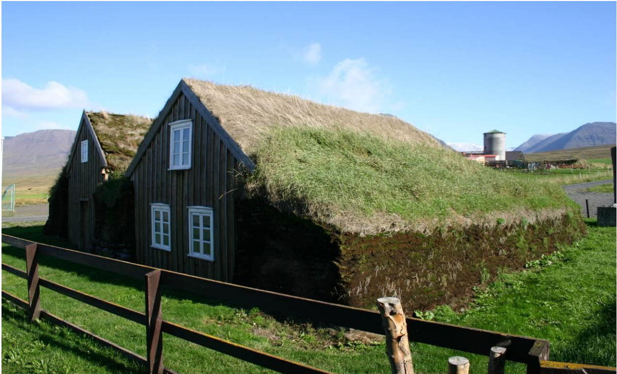
Stóru-Akrar, þingstofa nær en bæjardyr fjær. GLH 2007.