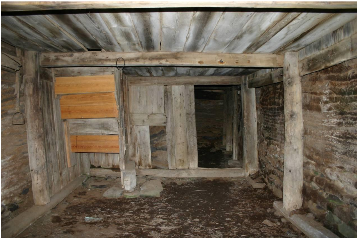
Stóru-Akrar, horft inn bæjardyr að bæjargöngum. GLH 2007.