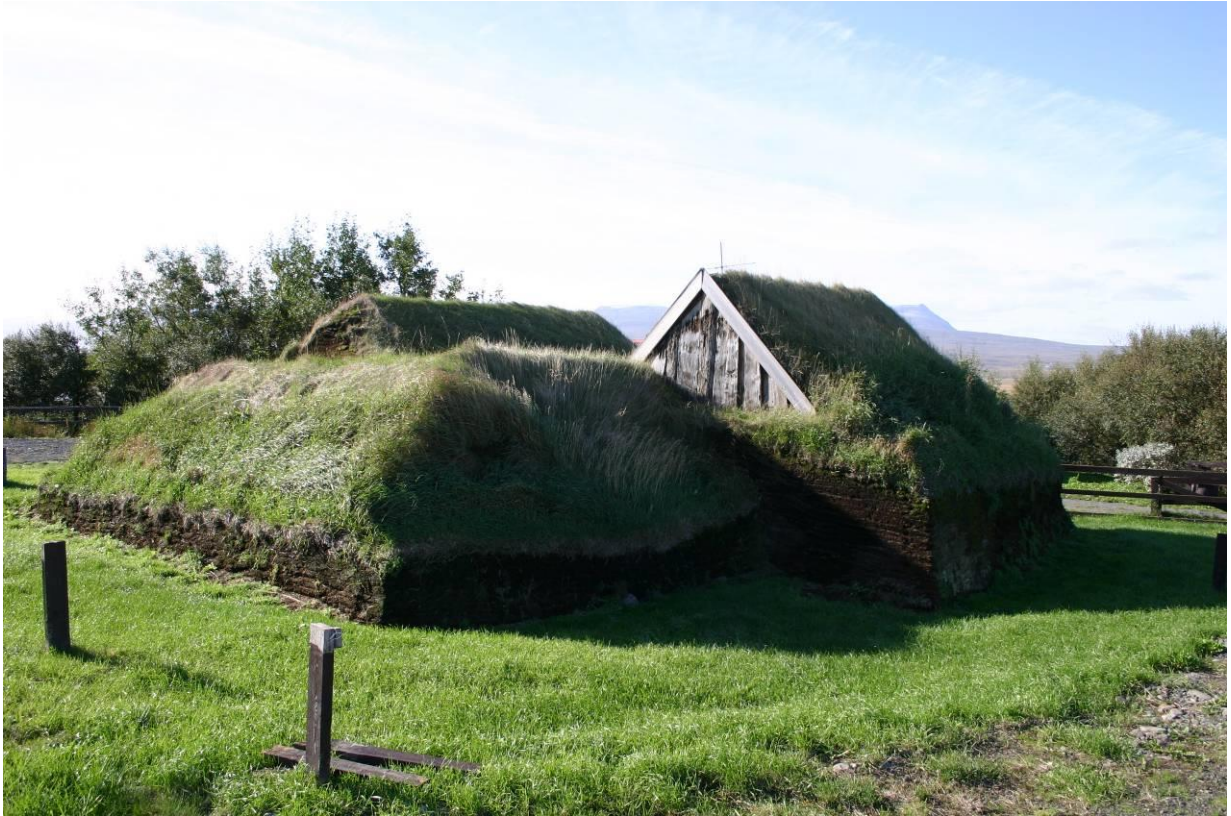
Stóru-Akrar, bæjardyr t.h, bæjargöng fyrir miðju og þingstofa t.v.. GLH 2007.